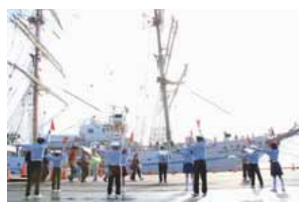
主催者の発表では、この2日間で3万人を越える来場者があった。

て、制服を着て海王丸の前での写真撮影、ステージでの手旗演連披露など、市民の皆さんとの触れ合いを深めた。ロープワークの体験では二日間約1000名の方に、団員たちが、いっしょけんめい説明し、一緒に結びを完成させていた。