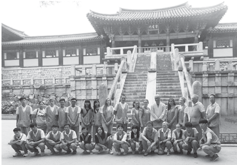
慶州の仏国寺の前で

お一人だったの で、団員、指導 者各1名という ミニマムの構成 でした。 仁川空港で出 迎えの方と初め てお目にかかる ので、すぐに分 かるのだろうか と心配していま したが、全くそ の必要は無く、 出迎えの女性と計3名 で普通車にて宿泊所へ。 その後は、香港からの 指導者1名とカデット 11名、UKからの指導 者2名とカデット8名 韓国からは指導者7名 とカデット4名の総勢 35名で、全て大型バス による移動となりまし た。 昼間、ソウル観光の あと、公式の歓迎会に 出席、翌日は延坪海戦 の犠牲者を記念したホー ルを見るなど、充実し た日々が続きました。 郡山ではレガッタに 参加。麗水ではコース ト・ガードの船で体験 航海したあと、午後は 水難訓練の要素を含ん だ水泳練習と、ここも 盛りだくさん。 その後、茂朱へ移っ てテコンドーのお稽古 もとらざしに出席しま したが、結局スケジュ ール遅延で、後から行っ た我々と合流。別れを 惜しみつつ、それぞれ の国へ旅立っていきま した。 帰国の日は、UKの 指導者1名とカデット 2名のフライトが午前 中だということ朝食 もとらざしに出席しま したが、結局スケジュ ール遅延で、後から行っ た我々と合流。別れを 惜しみつつ、それぞれ の国へ旅立っていきま した。