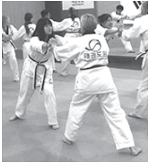
テコンドーの体験中

私は母の影響もあり 韓国ドラマとK-POP が好きで韓国の文化 に興味がありました。 そんな中、韓国での 国際交流があると聞き ぜひ行きたいと思っ たところ、いい経験に なるから行きなさいと 勧められました。 ちなみに私は双子で す。学校は別々ですが 2週間離れるのは初め でした。飛行機も初め で緊張しました。そん ななか、本当に感謝し たいのが、ついてき てくださった中島さ んにです。英語が中々 聞き取れない中、明 日の予定などを教え てくれました。私が 一人でいるときも興 味深い話などを聞か せてくれて楽しかっ たです。本当4日間は コミュニケーションが 取れず家族と連絡をと る度に泣いていました。 しかし、だんだんとコ ミュニケーションがと れるようになり本当に よかったです。 この国際交流で一番 記憶に残ったところは テコンドーです。あま り私は運動をしないの で運動できてよかった です。道着もかっ こよくて着れてよ かったです。また 韓国の国技なので 体験できて本当に よかったです。も う一つは明洞です。 ここはコスメショッ プがいっぱいありま す。韓国の子とまわら れたので色々とおス スメなものを教えて くれたりしたので本 当によかったです。本 当にいい経験になっ たので行ってみたい 人がいたら是非参加 してみてください。