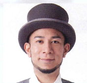
グローバー (ミュージシャン タレント)