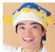
さかなクン (東京海洋大学 名誉博士・客員教授)