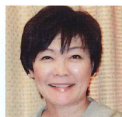
安倍昭恵 (第98代総理夫人)